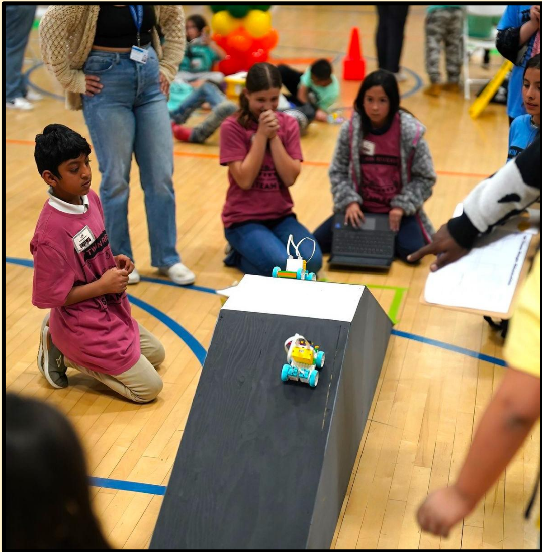
Twin Rivers student science activities.