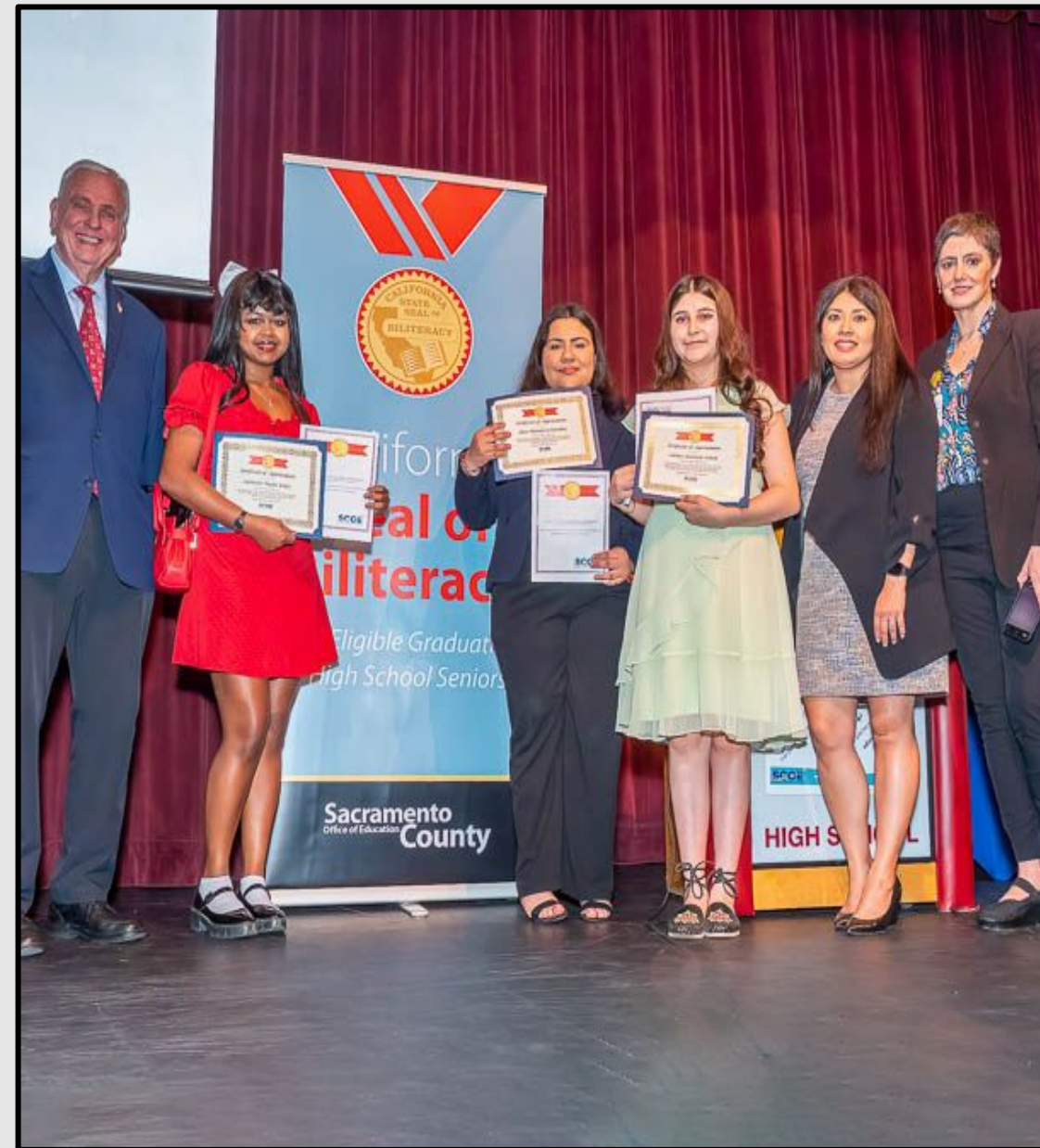
SCOE State Seal of Biliteracy 2023 ریاست مهر SCOE د 2023 کال دوه اړخیزه د