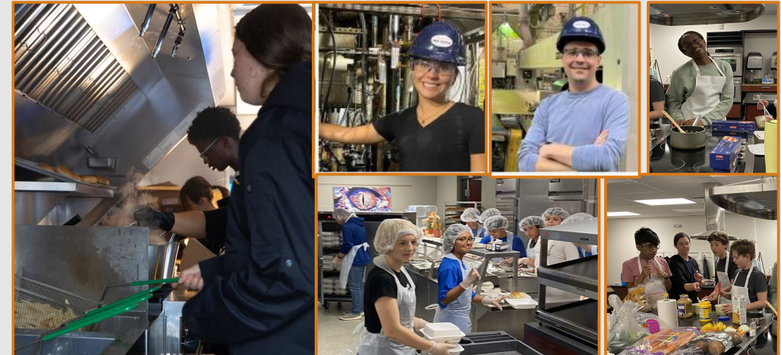
Career and Technical Education Food Truck