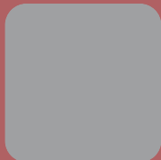
Vacante ÁREA 1